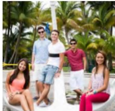
Students exploring the city