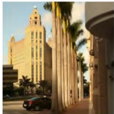
Miami - Coral Gables area

Hay tanto que hacer en Miami, si eres entusiasta de las artes, amante de la comida, adoras el sol, este campo de juego de élite promete muchas opciones. Nuestra escuela en Miami ofrece la oportunidad de estudiar en la cálida y soleada Florida con eventos organizados y actividades en lugares como South Beach y Disney World. Situada a dos manzanas de la estación de metro y con parada de tranvía en la misma calle de la escuela, se encuentra en la hermosa Coral Gables, donde encontrarás cantidad de lugares históricos, 22 parques, 33 canchas de tenis, 2 campos de golf y muchos otros servicios de primera clase. Las atracciones locales incluyen un gran jardín botánico tropical, cuevas submarinas, senderos, etc. Al otro lado de la calle de nuestro centro hay un hermoso centro comercial que ofrece una amplia gama de tiendas, cafés y restaurantes, con gimnasio y spa.