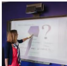
Classroom with SMART Board®